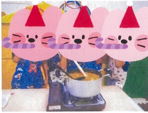
かっこいいグループ