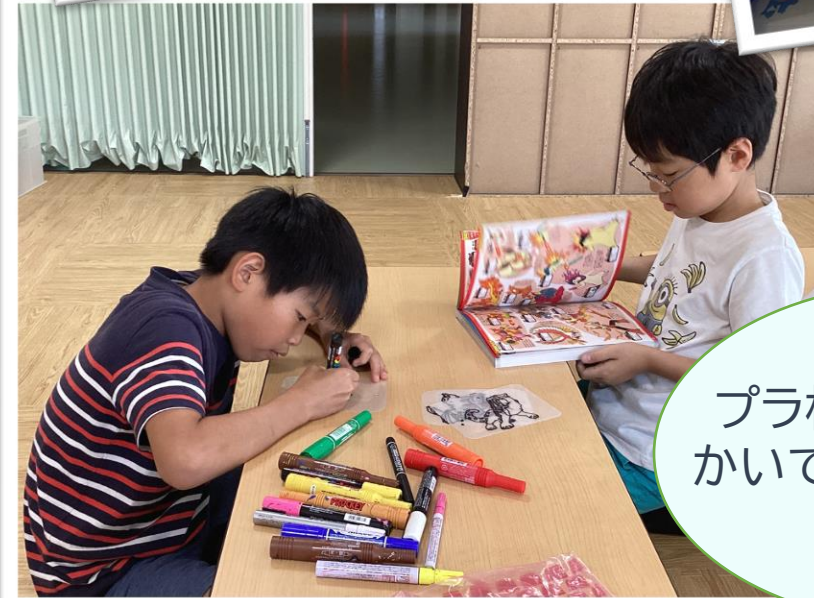
プラ板に好きな絵をかいてキーホルダーを作ったよ