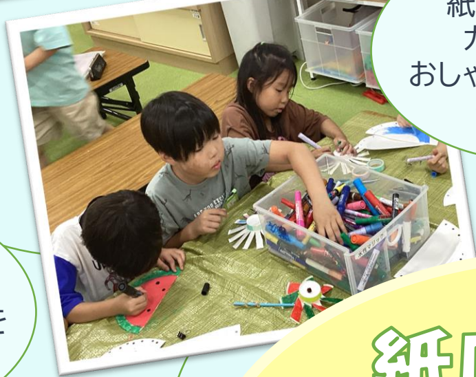
紙皿を使ってカラフルでおしゃれなバッグを作ったよ